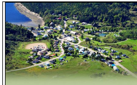
Visite à Sainte-Rose du Nord