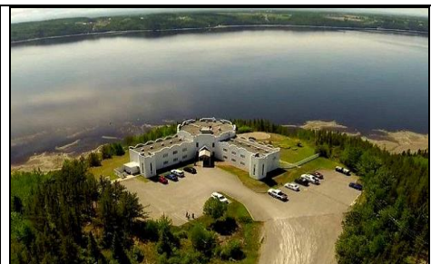
Lieu rassemblement à St-Fulgence "Auberge La Tourelle du Fjord"

Secteur Saguenay, chapitre-hôte Saguenay/Lac-St-Jean