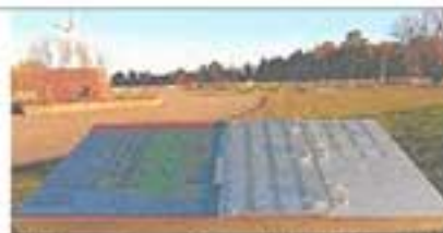
Mémorial au cimetière de Rivière-Ouelle