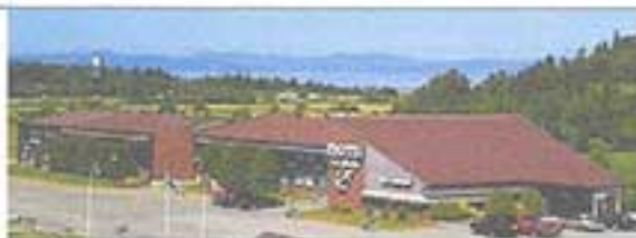
Auberge Cap Martin, La pocatière